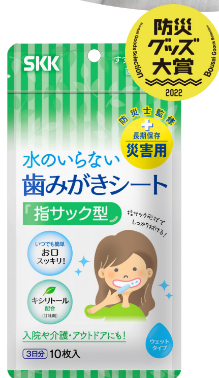
▲歯みがきシート 3日分/10枚入