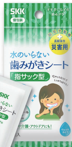
▼歯みがきシート 1枚入(3包セット)

95年の阪神・淡路大震災では、多くの方が肺炎で命を落とされました。 その主な原因は、口内細菌の繁殖が原因となる誤嚥性肺炎であったと考えられています。 衛生環境の維持が難しい避難所で、特に高齢者にとって歯みがきは『命』を守る事に繋がります。 また虫歯や歯周病は勿論、口臭が気になる事で人と関わりにくくなり、 避難生活のストレスが増す結果、発病や持病を悪化させる原因にもなります。 災害時だからこそ、人としての『尊厳』を守る事が重要です。