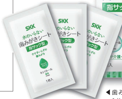
◀歯みがきシート 1枚入